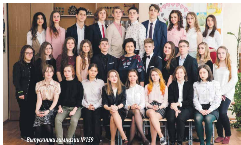
Выпускники гимназии №159

У каждого учебного заведения была подготовлена праздничная программа прощания со школой. В этот день исполнялись литературно-музыкальные и лирические композиции, звучали трогательные признания в любви педагогам за терпение и отзывчивость. По традиции в зале кружились в вальсе юноши и девушки, что придавало мероприятию ностальгическую ноту.